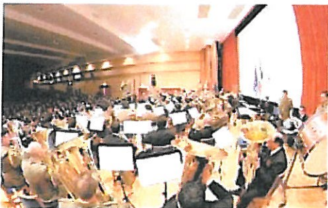
L'Orchestra della Croce Rossa Italiana